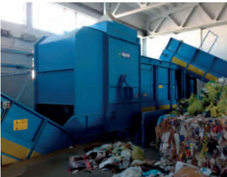
Вскрыватель мешков мод. AS8 2000 - Bag opener mod. AS8 2000