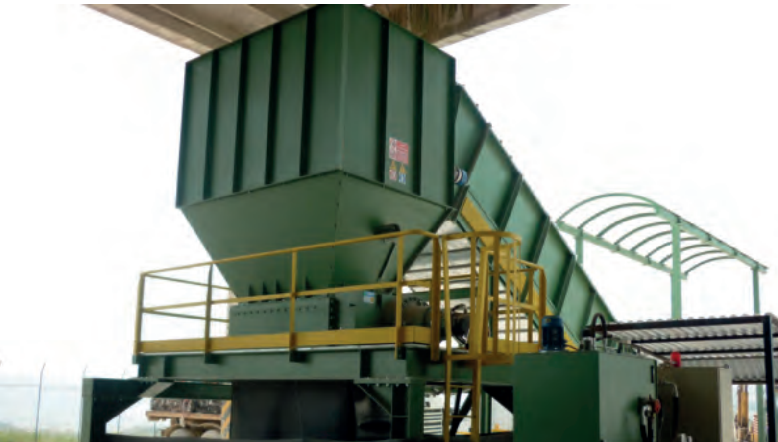
Измельчитель мод. TR 150 - Shredder mod. TR 150