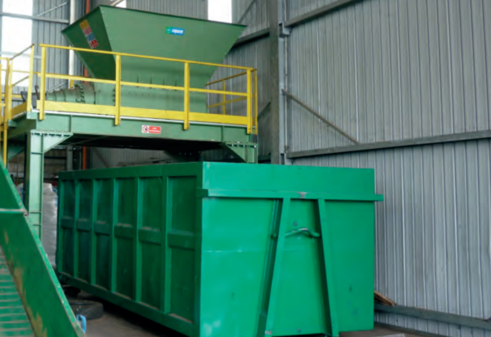
Измельчитель мод. TR 100 - Shredder mod. TR 100