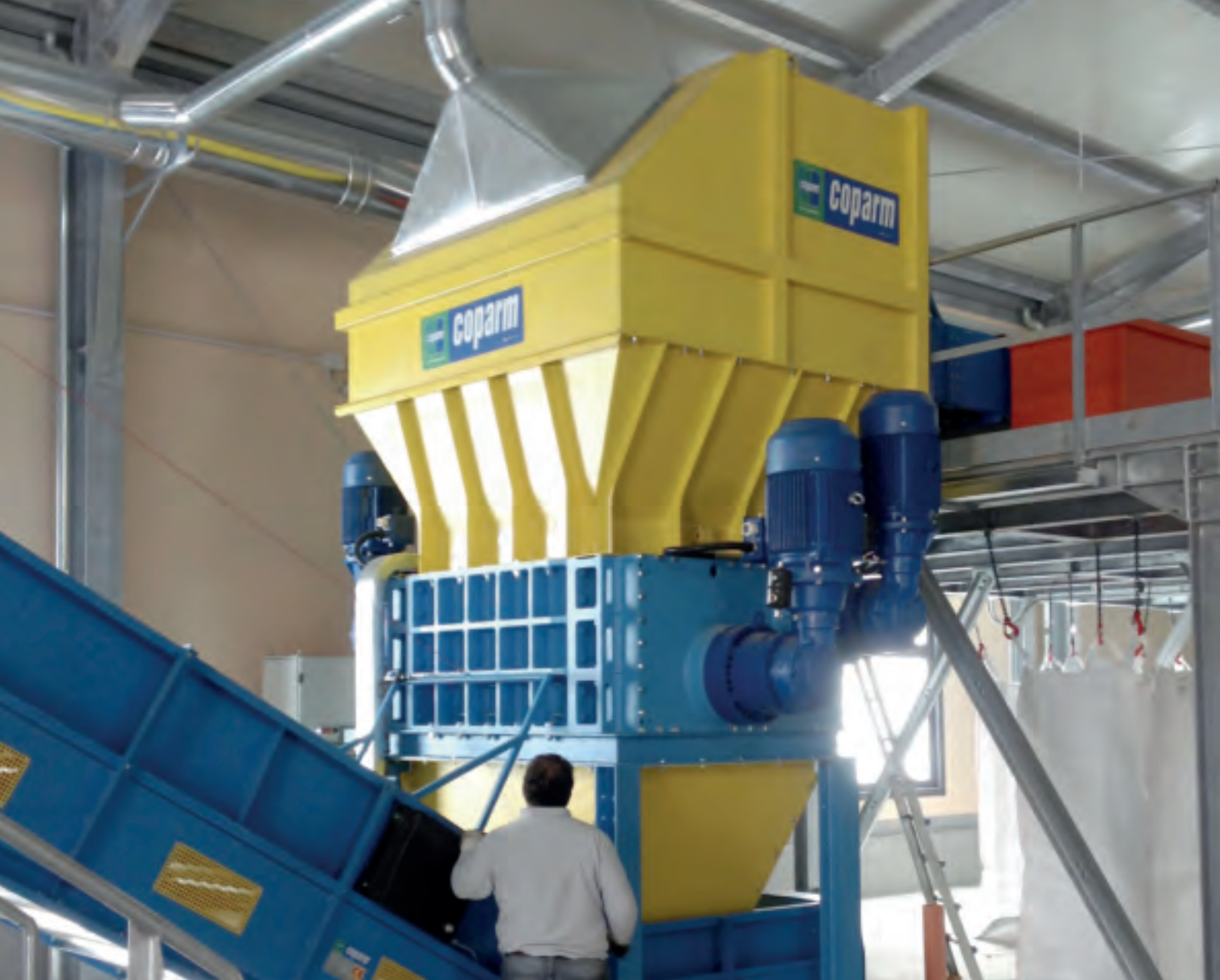
4-х вальный измельчитель - Four shafts shredder