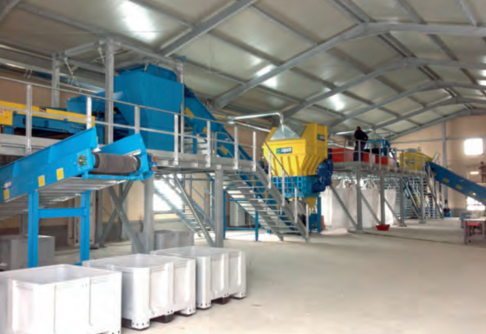
Переработка электроники - Electronic waste treatment plant