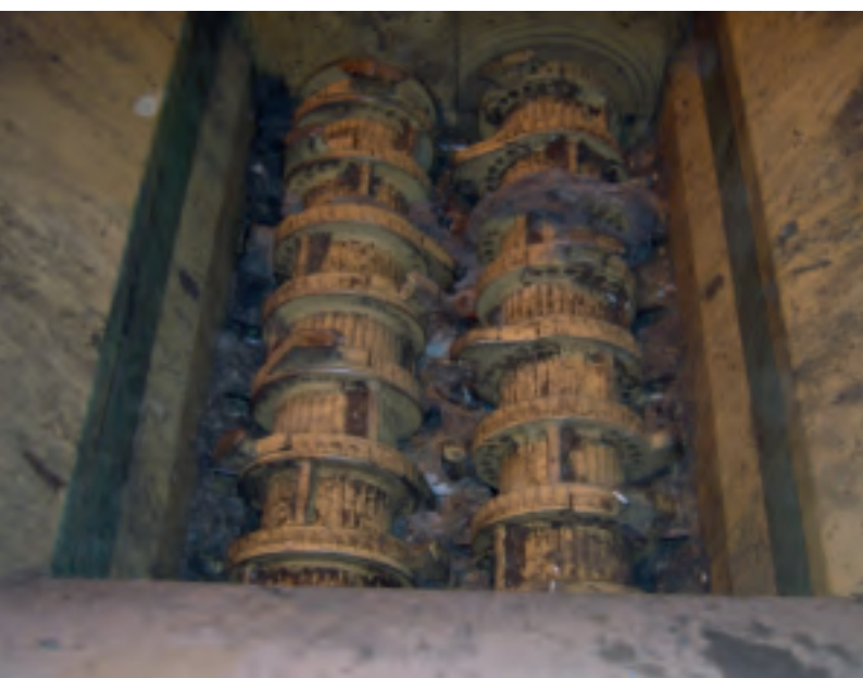
Вскрыватель мешков APR 300 - Bag opener APR 300