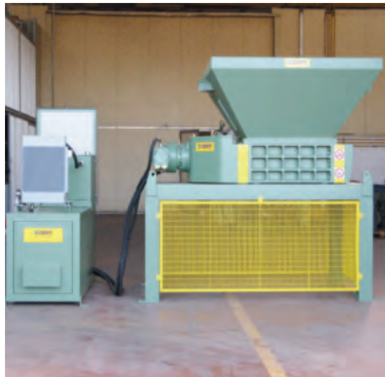
Измельчитель мод. TR 50 Shredder mod. TR 50