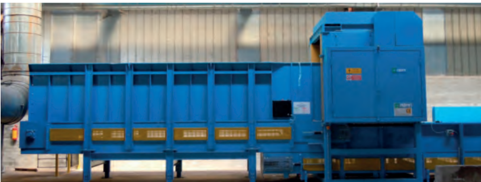
Вскрыватель мешков мод. AS8 1500 - Bag opener mod. AS8 1500