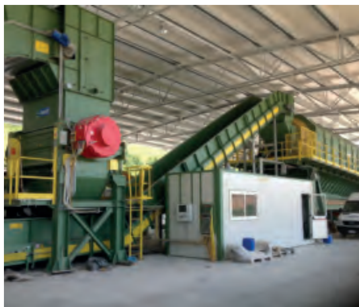
Линия сортировки ТБО 50-60 ton/h MSW sorting plant 50-60 ton/h