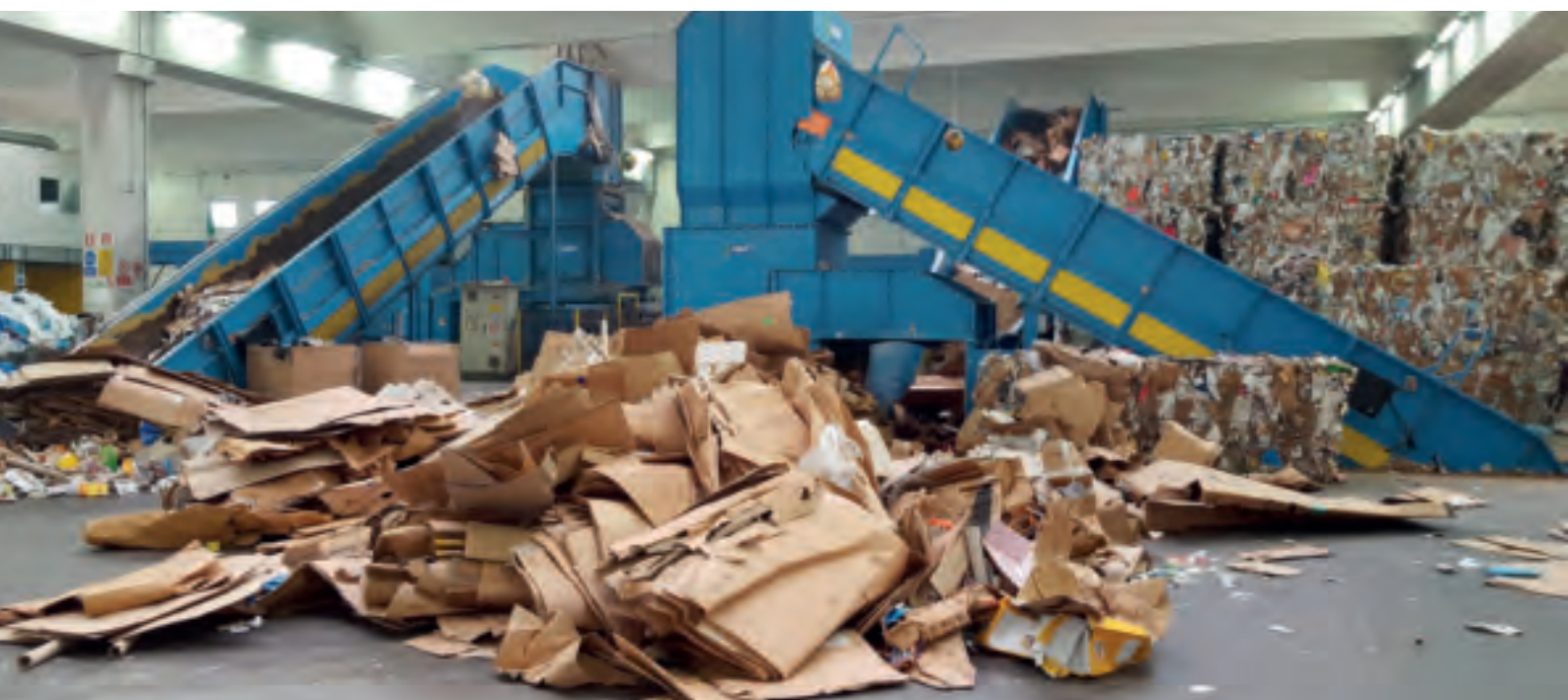
Измельчитель бумаги не пригодной для вторичного использования мод. TC 100_15 - Waste paper shredder mod. TC 100_15